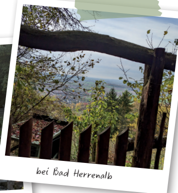
bei Bad Herrenalb