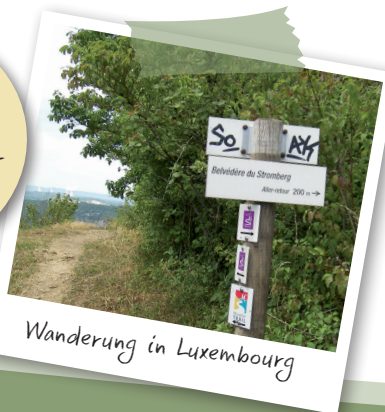
Wanderung in Luxembourg

Kommt doch mal mit! Wir freuen uns über neue Wanderfreunde